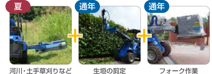
夏 通年 通年 河川・土手草刈りなど 生垣の剪定 フォーク作業

公園など公共施設などの 緑地の整備 から 災害時の 撤去作業 、厳冬期の 除雪 まで