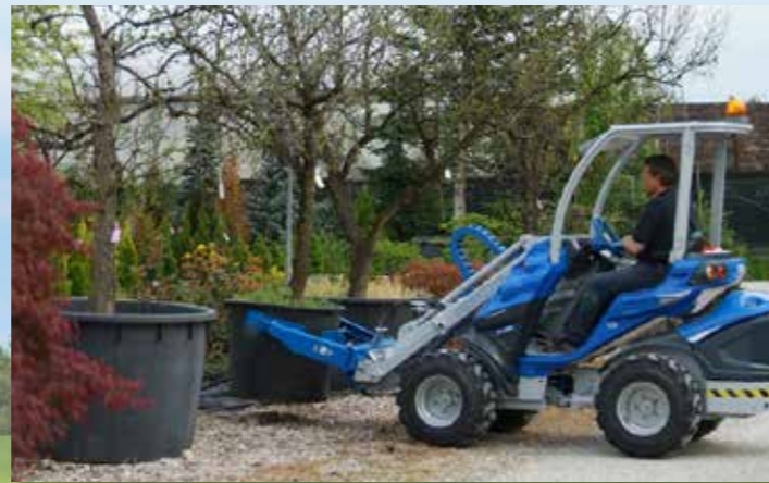
造園・植木・草刈