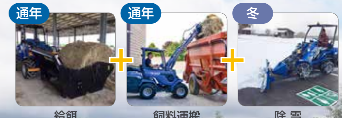
通年 通年 冬 給餌 飼料運搬 除雪

給餌や堆肥 運搬 、 除草 、 除雪 、etc. 中・大規模な牧場での作業を完全サポート