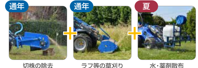
通年 通年 夏 切株の除去 ラフ等の草刈り 水・薬剤散布