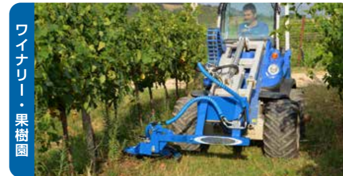
ワイナリー・果樹園