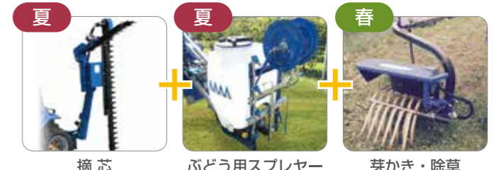
夏 夏 春 摘芯 ぶどう用スプレーヤー 芽かき・除草